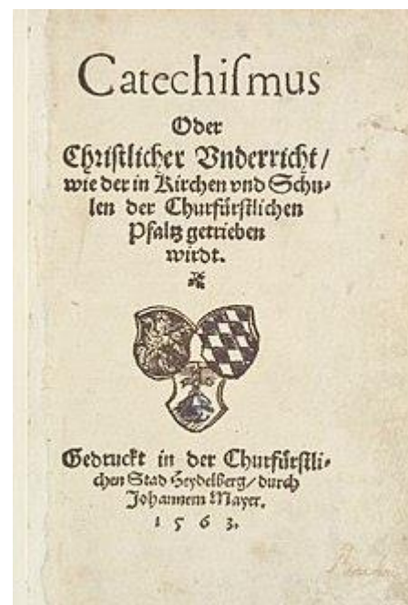
Frontespizio dell'edizione del 1563 del Catechismo di Heidelberg

Questo Catechismo venne approvato dal Sinodo di Heidelberg nel 1563.