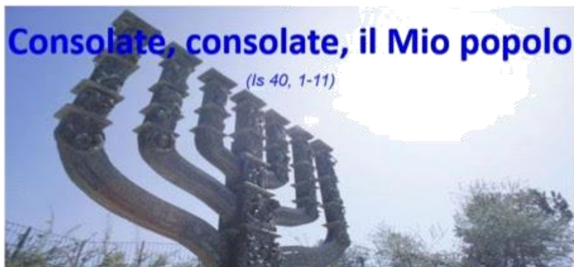
tavola rotonda sul tema: