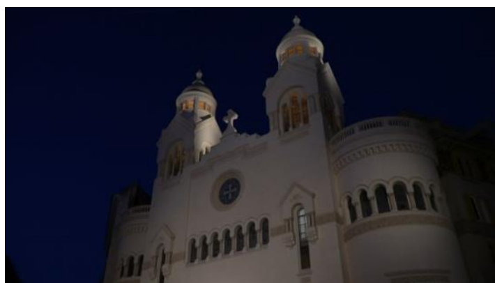
Chiesa evangelica valdese – Piazza Cavour – Roma

Una chiesa è storia, tradizioni, memoria. Un patrimonio di beni culturali, materiali e immateriali, da conoscere, conservare, tramandare.