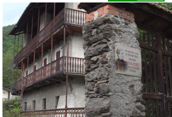
Immagine tratta dalla puntata di Protestantesimo