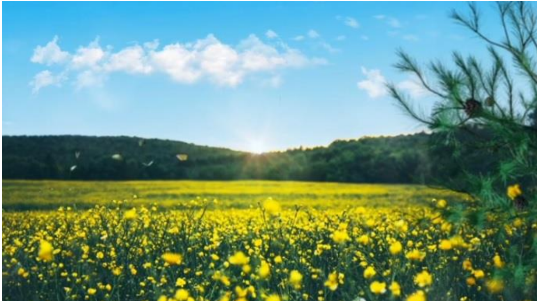
Frame tratto dal video della GLAM sui “Corridoi ecologici” per insetti impollinatori

Roma (NEV), 2 ottobre 2024 – Il 4 ottobre chiude il periodo liturgico conosciuto come “ Tempo del Creato ”. Apertosi il 1° settembre, per convenzione stabilita a livello ecumenico, il Tempo del Creato termina nel giorno in cui i cattolici celebrano Francesco d’Assisi. In questo periodo si realizzano, in tutto il mondo, iniziative congiunte, incontri, celebrazioni. Per quanto riguarda l’Italia, e in particolare le chiese protestanti, la Commissione globalizzazione e ambiente (GLAM) della Federazione delle chiese evangeliche in Italia (FCEI) ha promosso e partecipato a diverse iniziative.