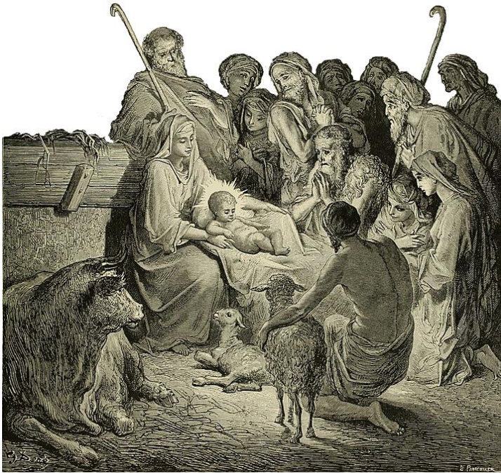
Gustave Doré (La Grande Bible de Tours)

L'esposizione sarà inaugurata domenica 8 dicembre alle ore 16, e proseguirà nei giorni di lunedì, martedì e mercoledì (ore 10.30-12.30 e 14.30-17.30)